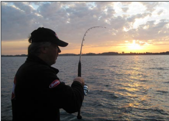
Volop platvis voor de haven op 13m diepte

D insdag een waaidag maar tegen de avond zagen we met een afnemende wind toch nog kans een 2-tal uurtjes op de platvis te