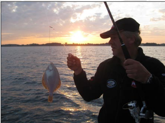
Elke worp leverde één of twee scharren op

gaan. Vanuit de haven in noordoostelijke richting voor anker gegaan op zo'n 13 meter water. Ongelofelijk hoeveel schar hier rond zwemt! Ik zou weleens een kijkje onder water willen maken want er moet een tapijt aan scharren gelegen hebben. Praktisch elke worp leverde één of twee scharren op. Zelfs bij het lijn geven na de worp werden er al felle rukken gegeven aan de hengeltop. De 20 grootste scharren gaan mee voor de pan.