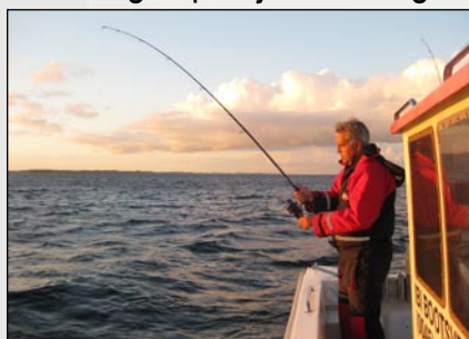
Het ultiem gevoel van vrijheid

H et begint met het ultieme gevoel van vrijheid als onze boot de weidsheid van de Deense Oostzee opzoekt. De kennis en ervaring van de afgelopen jaren brengt ons op stekken