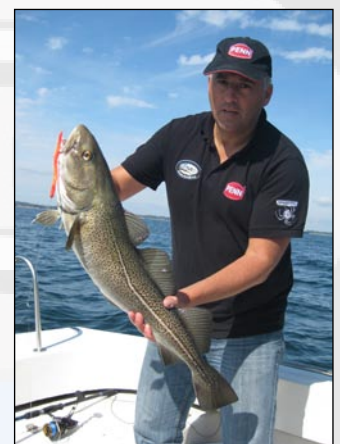
Op de bijvangst

Hij leek nog even Cees van de troon te stoten maar zijn doublet van respectievelijk 7 kg. en 8,6 kg. mocht er zeker zijn. In totaal deze dag 22 vis-sen tussen de 70 en 95 cm. Een bepalende factor is, het steeds weer goed aansnijden van de drift over de vangende stek, gebruik makend van de GPS en een mooie driftsnelheid van zo'n 3 km/u waardoor de shad goed aangeboden kan worden aan de bodem. Een tweede belangrijke factor is uiteraard het feit dat een school kabeljauwen op dat moment een bijtperiode hebben ingelast. Een bootje met 2 jonge Duitse sportvissers hadden al snel het kunstje in de gaten en konden mooie driften achter ons aan maken waardoor ze ook een